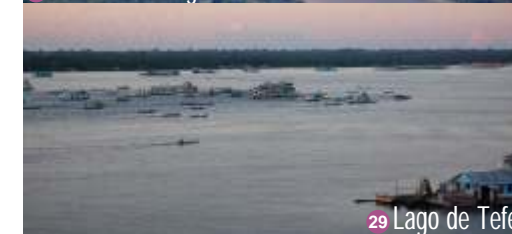
29 Lago de Tefé