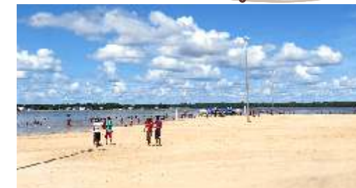
32 Praia da Ponta Branca