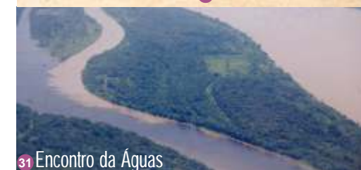
31 Encontro da Águas